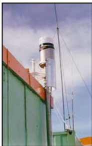
Piranômetro instalado na Estação Brasileira da Antártica, estação Comandante Ferraz.

A figura abaixo mostra a relação entre a radiação UV e os fluxos solares.