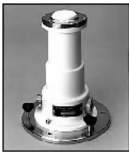
Total Ultraviolet Radiometer, Eppley

Os piranômetros usados são os para ondas curtas.